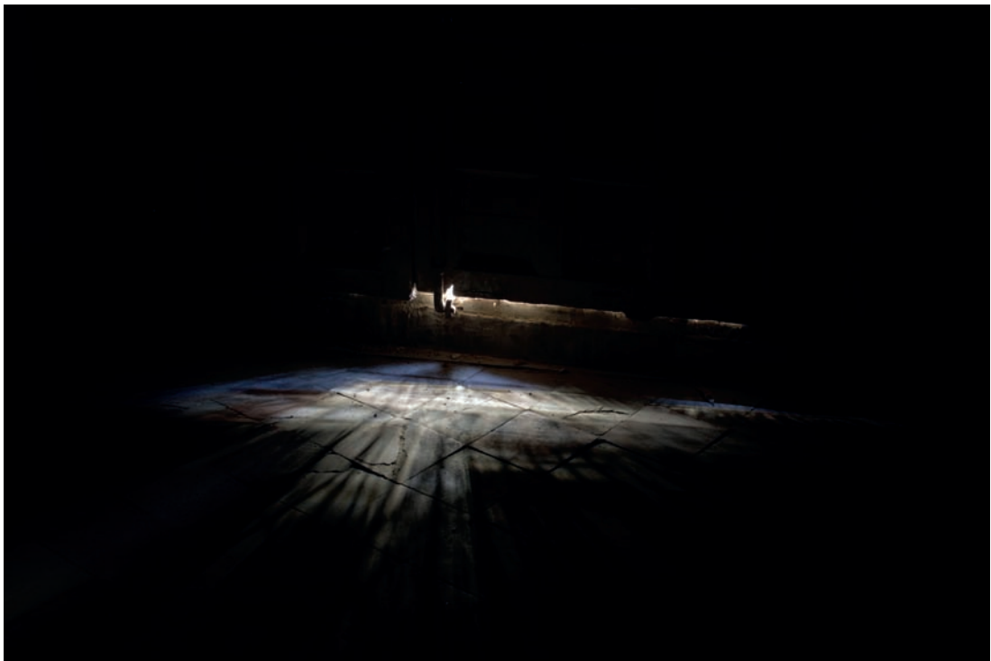
La luz I-II , 2016

Ochenta años después recorro la casa a oscuras, escuchando los sonidos apagados que llegan de la calle, siguiendo los rastros de luz que se cuelan por los quicios de balcones y ventanas. La luz, metáfora de la verdad y el conocimiento, conecta interior y exterior, lo público y lo privado, y denuncia la represión frente a la libertad.