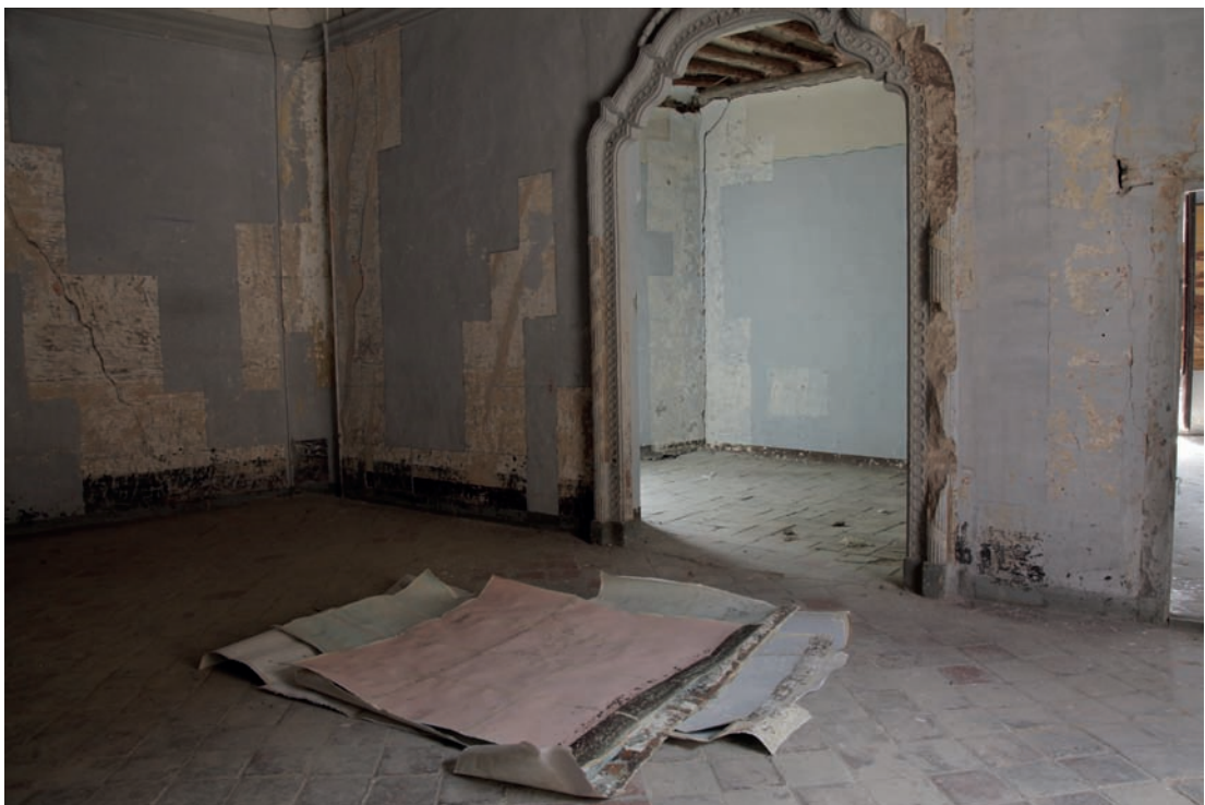
Fotografías del proceso