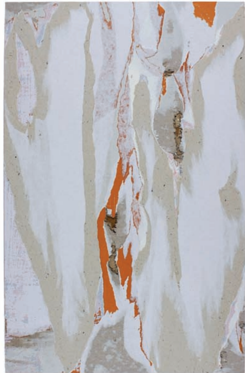
Palimpsestos I-X , 2016 Serie de 10 collages 30,50 x 18,50 cm